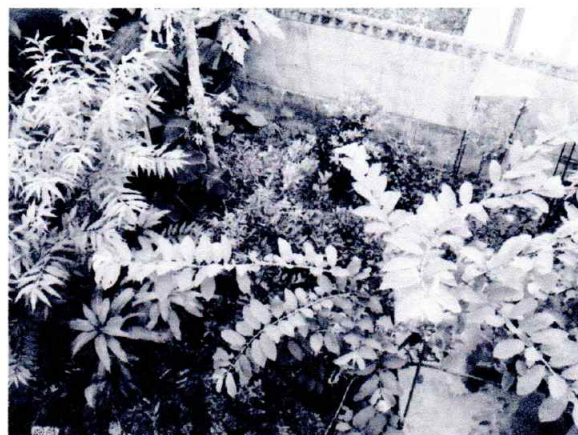
数種類の熱帯果実が林立する裏庭

私の農民の血はとどまることを知らない。ついには畑を手に入れ、耕運機も購入し家庭菜園の枠を飛び越えてしまった。自然も愛する乳がんオタクハルサーとして新たな人生を歩みだした。